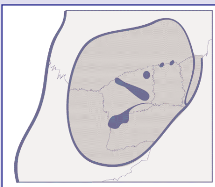
Abb. 1: Orbita

Die Orbita wird von sieben Knochen gebildet: dem Os frontale, dem Os sphenoidale, der Maxilla, dem Os lacrimale, dem Os ethmoidale, dem Os zygomaticum und dem Os palatinum. Die Knochen stammen von der Schädelbasis, vom Schädeldach oder vom Gesichtsschädel ab.