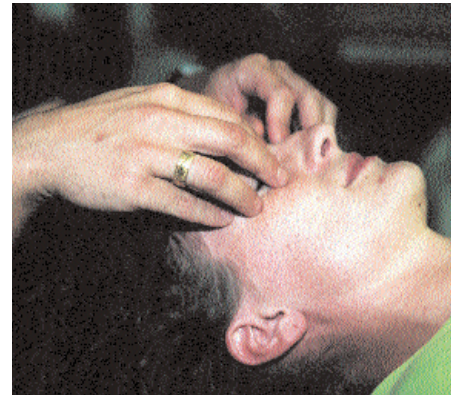
Allgemeine Behandlung der Orbita

– Sekundär, z.B. durch Störungen der Synchronosis/Synostosis sphenobasilaris (siehe auch Liem: „Scoliosis capitis“ in Stillpoint 1999), durch primäre Dysfunktionen des Körpers mit abnormen faszialer Spannung, die sich in die Orbita fortsetzen, sowie emotionale Traumata.