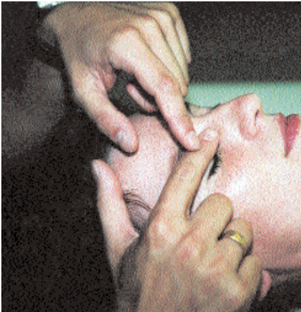
Glaukom-Technik nach Ruddy